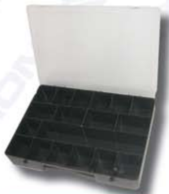
Nr. katalogowy P 18

Płaska, zamykana skrzynka o wymiarach 33cm x 22cm x 5cm z 18 przegródkami. Różne wymiary przegródek umożliwiają magazynowanie spinek o różnych gabarytach.