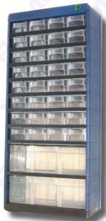
Nr. katalogowy P 38

Płaska, zamykana skrzynka o wymiarach 33cm x 22cm x 5cm z 18 przegródkami. Różne wymiary przegródek umożliwiają magazynowanie spinek o różnych gabarytach.